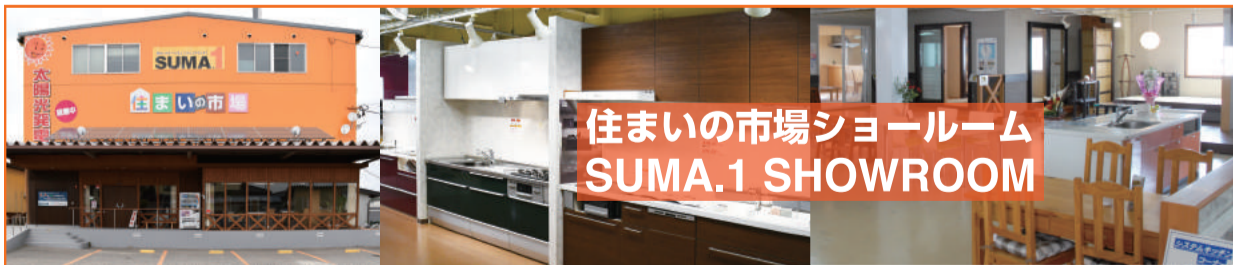
住まいの市場ショールーム SUMA.1 SHOWROOM