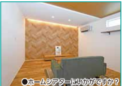
●ホームシアターにいかがですか？

【物件概要】保原弥生町オープンハウス ●所在地: 伊達市保原町字弥生町 53 番地 ●交通: 阿武隈急行「保原駅」徒歩 11 分 ●学区: 保原小学校・桃陵中学校 ●建物: 木造軸組パネル工法 平屋 ●建築面積: 78.6㎡ (23.79 坪) ●延床面積: 75.35㎡ (22.79 坪) ●敷地面積: 171.96㎡ (52.01 坪) ●地目: 宅地 ●用途地域: 第 1 種住居地域 ●建ぺい率: 60% ●容積率: 200% ●道路: 西側4m ●販売価格: 3,080万円 (税込) ●広告有効期限: 令和 6 年 12 月 31 日 ※並列駐車 3 台可 ●売主につき仲介手数料不要 【設備等についての詳細】 住宅用太陽光発電システム (11.62kWh) ・ オール電化 ・ 全室 LED照明完備 ・ エアコン家具カーテン付 ・ TVインターフォン付 ・ バリアフリー設計 ・ 高断熱ダブルペアガラス採用 ・ アカシア無垢床 ・ 住宅ローン控除対応